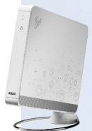
Mini PC intégré